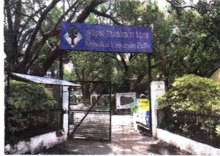
New alternatives: Ambedkar University's cut-offs are lower than those set by Delhi University.

The university reserves 85% of its seats for candidates from the NCR and therefore, released two cut-off percentages in the general category